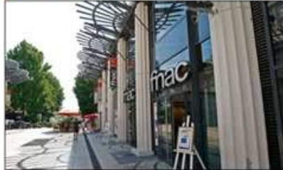
Une proposition marchande forte et diversifiée (commerçants indépendants et enseignes nationales)