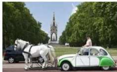
Développer l'accessibilité (nouvelles mobilités, praticité, traitement du stationnement...)