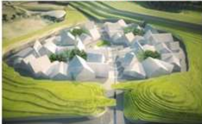
Miser sur les valeurs du local (local is beautiful)